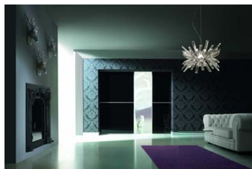
Zdjęcie 3 Profil aluminiowy podwójny, szerokość frontu 1200 mm, wysokość 2200 mm /2 szt./ i wypełnienie lacobel Czarny, długość toru ok. 5 m

Wygospodarowaną przestrzeń możemy dowolnie wykorzystać, a co bardzo ważne nie zajmują tyle miejsca, co klasyczne drzwi. Ponad to pozwalają zachować jednolite przejścia pomiędzy pomieszczeniami, które, nie naruszają powierzchni podłogi.