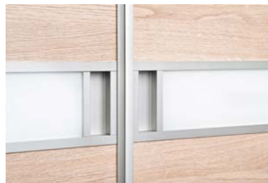
Zdjęcie 7 Uchwyt kasetowy - System drzwi podwieszanych podwójnych

Dzięki wieloletniemu doświadczeniu firmy Komandor, jej wyroby są perfekcyjnie wykonane, tak aby dawały maksymalny komfort użytkowania. Wysoka jakość systemów gwarantuje ich funkcjonalność przez wiele lat.