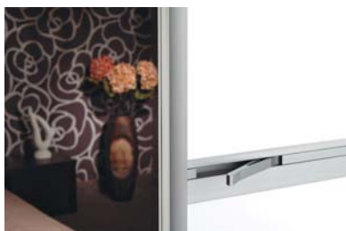
Zdjęcie 5 Klamka chowana System drzwi podwieszanych pojedynczych