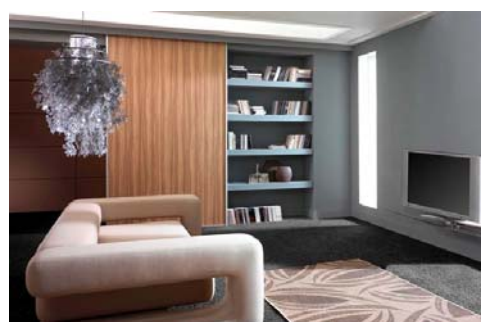
Zdjęcie 1 Profil aluminiowy pojedynczy, szerokość frontu 1200 mm, wysokość 2500 mm i wypełnienie zebrano afrykańskie, długość toru ok. 2,5 m

W ostatnich latach w naszych domach i mieszkaniach popularnością cieszą się otwarte przestrzenie, które dają poczucie swobody. Jednocześnie potrzebujemy osobnego miejsca na garderobę oraz przestrzeni do pracy. Ponad to chcemy ukryć lub zasłonić np. kuchenkę z widocznymi garnkami czy płaszcz wiszący w przedpokoju. W takich sytuacjach podzielenie przestrzeni staje się niezbędne.