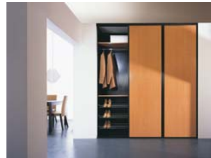
Zdjęcie 3 – profil stalowy, profil Lux Kolor czarny Wypełnienie - buk

Na odzież wierzchnią z kolei należy wygospodarować osobne miejsce przy drzwiach wejściowych. Najlepszym rozwiązaniem będzie odpowiednia wnęka na zabudowę z drzwiami przesuwными, w której zamkniemy wszystkie płaszczyki i czapki. Sprawdza się ona zarówno w przestronnych holach, jak i w bardzo małych korytarzach, gdzie trudno byłoby umieścić szafę z drzwiami otwierającymi się na zewnątrz.