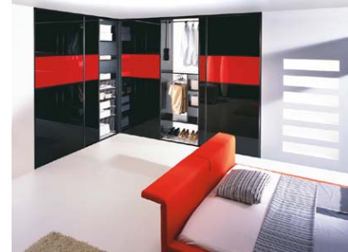
Zdjęcie 2 – system stalowy, profil Lux Kolor czarny Wypełnienie - szyba lakierowana czarna i czerwony

W mniejszych mieszkaniach zamiast osobnej garderoby, warto wybrać bardziej ekonomiczne rozwiązanie w postaci zabudowy z drzwiami przesuwными. Zabudowy firmy Komandor mają tę zaletę, iż możemy je umiejscowić zarówno w specjalnych, zaprojektowanych wnękach, jak też pod skosami. Musimy pamiętać, iż głębokość wnęki przeznaczonej pod zabudowę powinna wynosić min. 65 cm, aby nie pogniotły się w niej ubrania umieszczone na wieszakach.