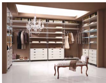
Zdjęcie 1 – system rurowy, profil aluminiowy Kolor – anoda naturalna Płyta – metalik beżowy

Na osobiste ubrania najlepiej przeznaczyć osobne pomieszczenie przy sypialni lub łazience. Wielkość lokum zależy od naszych potrzeb i liczby osób, które będą z niej korzystały. Systemy do zabudowy garderoby firmy Komandor umożliwiają maksymalne wykorzystanie przestrzeni. Planując wnętrze, trzeba uwzględnić odpowiednie miejsce na wieszaki, które powinny mieć szerokość min. 60-65 cm. W garderobie musimy również zaplanować półki na buty czy kosz z brudną bielizną.