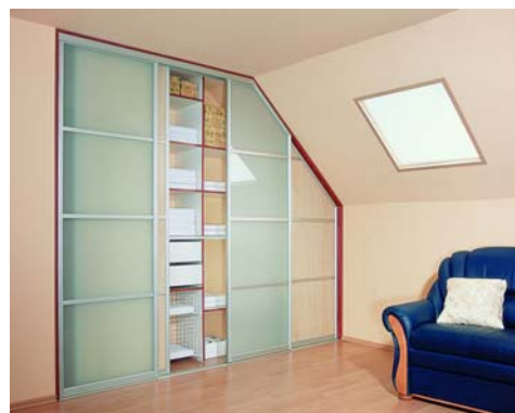
Zdjęcie 1 Zabudowa wykonana w systemie aluminiowym profil Agat anoda naturalna Wypełnienie frontu: szyba mleczna dwa skrzydła i płyta dzika grusza

Ustawienie w tym miejscu zabudowy z drzwiami przesuwными, pozwala na efektywne wykorzystanie przestrzeni pod skosami, które nie jest możliwe przy zastosowaniu tradycyjnych mebli. Zagospodarowanie skosu szafą lub umieszczenie schowka we wnęce pod oknem to bardzo proste i niezwykle praktyczne rozwiązanie. Doskonale sprawdzi się ono w pomieszczeniach, takich jak pokój dziecięcy czy garderoba. Meble robione na wymiar firmy Komandor, pozwalają na dopasowanie szafy do każdego pomieszczenia, niezależnie od jego charakteru. Ciepła kolorystyka drzwi będzie znakomicie współgrała z dziecięcymi mebelkami, zaś mebel wykonany z aluminium i szkła podkreśli elegancję pokoju rodziców.