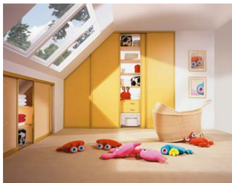
Zdjęcie 2 System aluminiowy, profil Agat Kolor – anoda złota Wypełnienie – terra żółta Wnęka pod oknem Profil aluminiowy Agat Kolor anoda złota Wypełnienie – płyta meblowa loom